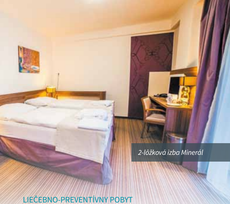
2-lôžková izba Minerál